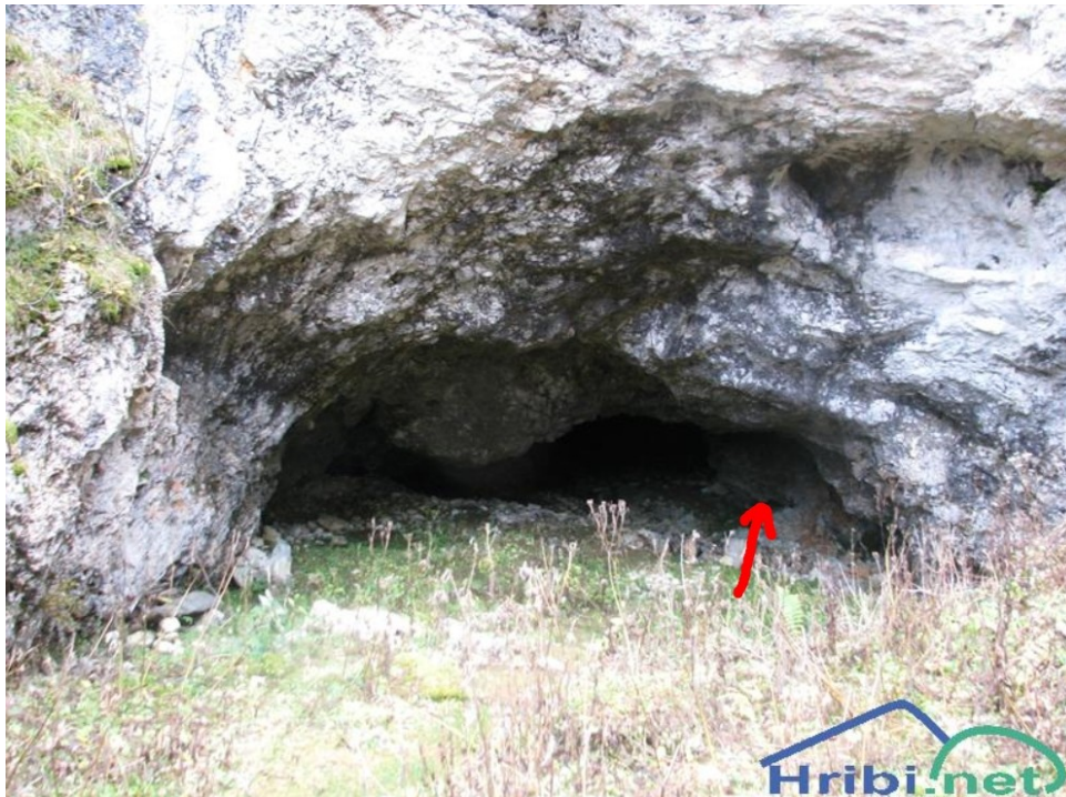
Ustje Medvedje zijavke; lego megalitnega balvana označil pisec.