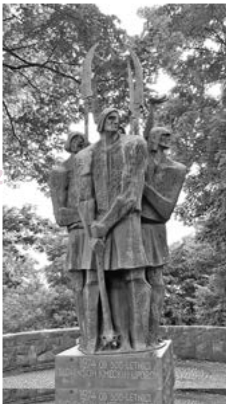
Slika 3: Spomenik kmečkim uporom na Ljubljanskem gradu

Koseška naloga je vključevala tudi pomoč pri obrambi večjih gradov, ker so imeli gradovi glede na svojo velikost, premajhne posadke. 82 Primeri takih gradov so: Celjski zgornji grad, Krnski grad in grad Kamen v Begunjah. Torej so kosezi ostali zvesti vladarju, ki je podpiral novi fevdalni red in vse hujše izkoriščanje kmetov.