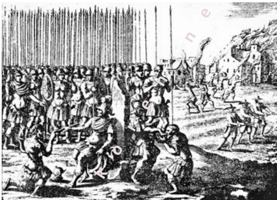
Slika 2: Podeljevanje fevdov na Vojvodskem stolu (vir: glej opombo 63).

Kranjska) pa se je ohranil spomin na ustoličevanje v obliki obreda, vse do 18. stoletja. Zadnjič se je zgodil leta 1728. Ob vsakokratnem dednem poklonu novemu deželnemu knezu, med obiskom Ljubljane, je kosez Logar v slavnostnem sprevodu v mesto peljal okrašenega vola in ga predal vladarjevi kuhinji. Prisotnost kosezov, eden izmed njih se je imenoval Kamnar (nakazuje na knežji kamen), dedni poklon, okrašeno govedo in sprevod potrjujejo, da je opisani obred spomin na ustoličevanje na Kranjskem (v Karnioli). 62 V katerem kraju na Kranjskem se je obred prvotno izvajal, še vedno ni znano. Nakazujeta se dve lokaciji: Gradišče nad Bašljem in cerkev sv. Petra v Ljubljani.