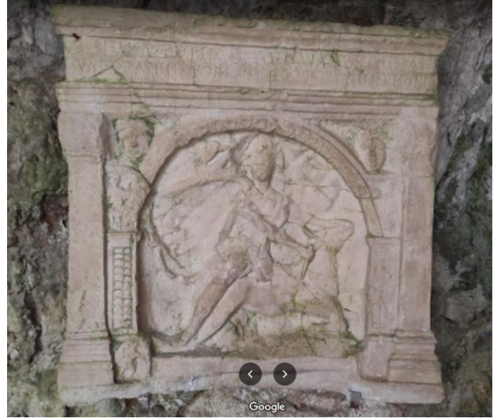
Mitrajsko svetišče v jami nad Štivanom in podoba Mitra, ki ubija bika.

K nam so mitraizem zanesli rimski vojaki. Na jugu Rimskega imperija je bilo vreme podobno tistemu v Perziji (približno sedanji Iran). Gotovo je mitraizmu botrovala potreba po hladu in vodi, značilnostih hladne polovice leta. Temu primerno se mitrajska svetišča oziroma mitreji nahajajo na senčnih krajih ali v votlinah.