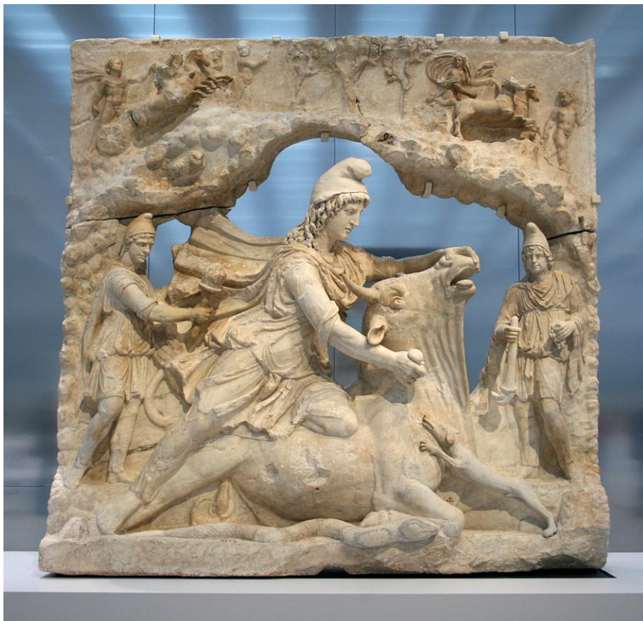
Muzej Louvre-Lens, Francija

Gre za Mitra, ki ni nikoli imenovan sveti. Lahko je le senčni junak. Najpogosteje se upodablja, kako ubija bika, čigar kri pije pes (simbol jeseni), pri nogah umirajočega bika pa leži kača (simbol zime); glej spodnji prikaz.